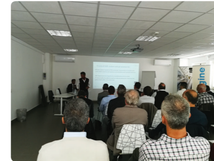
La formazione è pratica