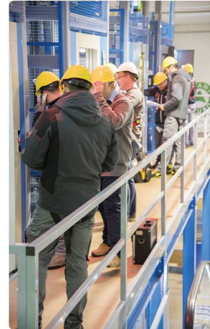
Simuliamo casi veri

innovativi al fine di individuare la miglior soluzione tecnico-economica per il Cliente e che sia compatibile con le norme vigenti.