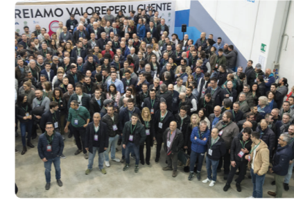
Il team del Consorzio TREE

La possibilità di affiancare i tecnici con l'assistenza da remoto e on-site dell'Ufficio Tecnico avanzato per individuare le soluzioni più efficaci circa le esigenze del cliente, rappresenta un valore aggiunto del Centro di Formazione. La tecnologia è un tassello importante per il Consorzio, il cui ufficio tecnico è composto non a caso da un team di professionisti che utilizza strumenti